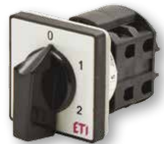
Diagram pripojení nájde v sekcii technické údaje