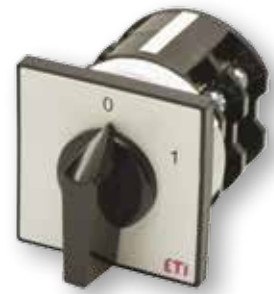
Diagram pripojení nájde v sekcii technické údaje