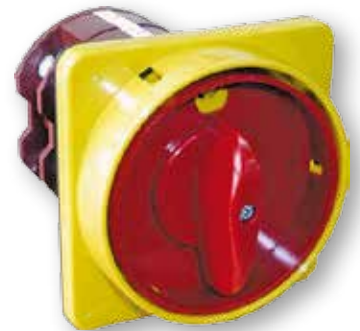
Diagram pripojení nájde v sekcii technické údaje