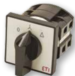
Diagram pripojení nájde v sekcii technické údaje