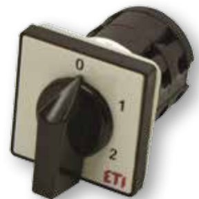
Diagram pripojení nájde v sekcii technické údaje