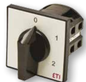
Diagram pripojení nájde v sekcii technické údaje