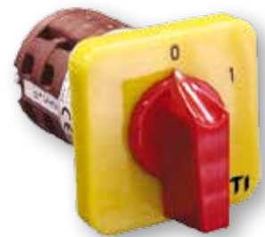
Diagram pripojení nájde v sekcii technické údaje