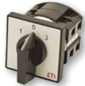
Diagram pripojení nájde v sekcii technické údaje